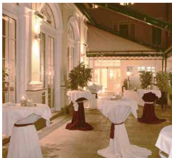
Weihnachtsaperitif im stimmungsvollen Hofgarten