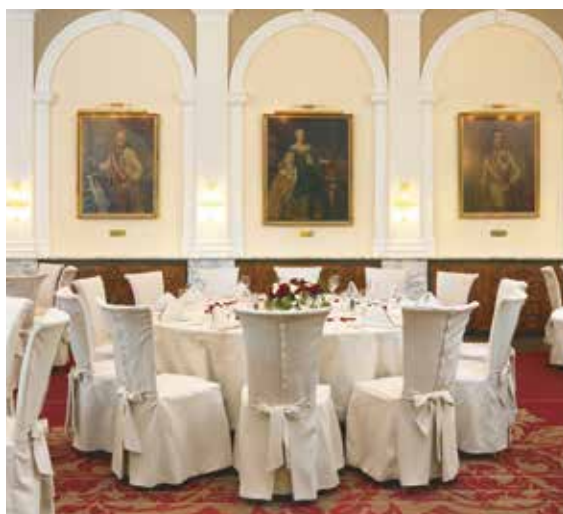
Festsaal 235 m 2 - in 3 Teile unterteilbar